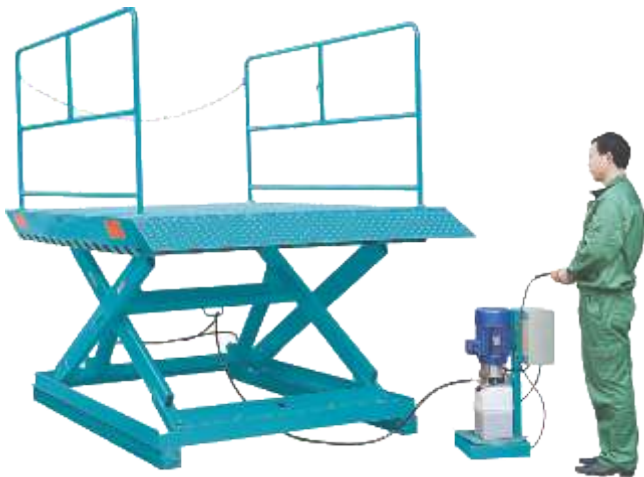
MODEL: AL1/AL2/AL3 (double hydraulic pump)